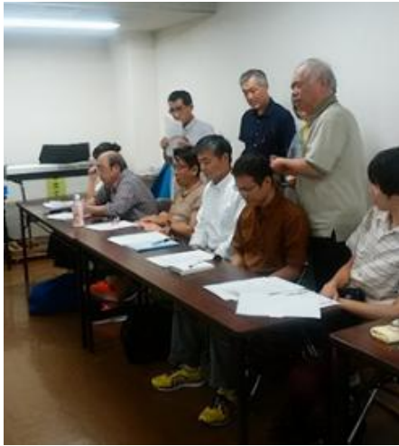
頭頸部痛に対する鍼治療の実技風景