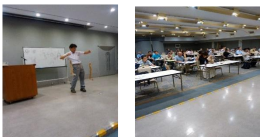
河野先生研修会風景