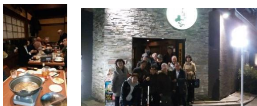
新年会風景 新年会参加メンバー

う方、どうぞご連絡ください。PCメールとワードが使用できれば、編集作業は可能です。